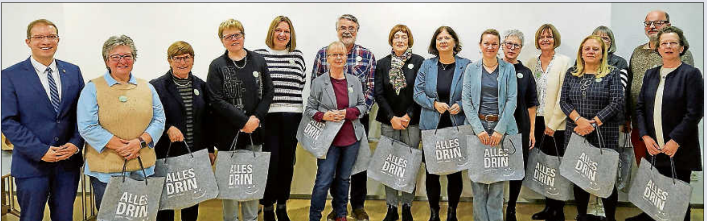
Das unermüdliche Team von der Kinder- und Jugendbücherei „Lesetreff“.