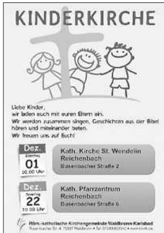
Plakat: M. Bartberger