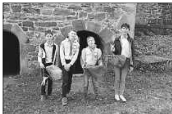
Einige Fallschirmspringer und ihre Schöpfer.