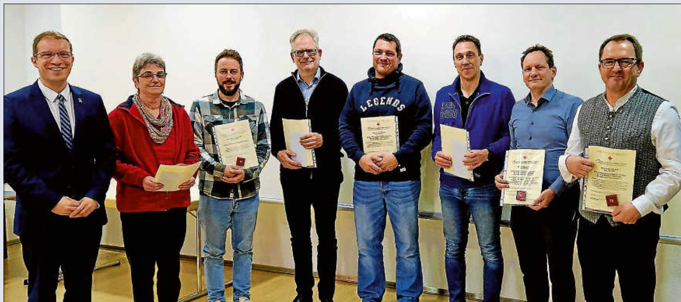
Die Blutspenderinnen und Blutspender lassen kaum eine Blutspendeaktion aus. Sie sind seit Jahren dabei und retten Leben.