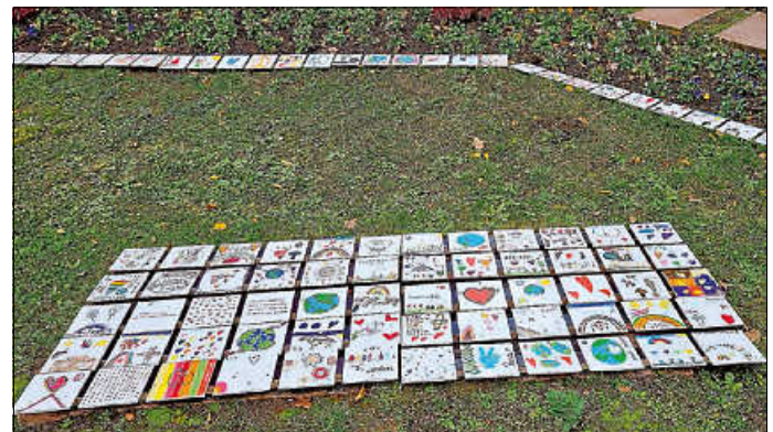
Die Hortkinder der Anne-Frank-Schule hatten Fliesen mit Friedensmotiven bemalt.