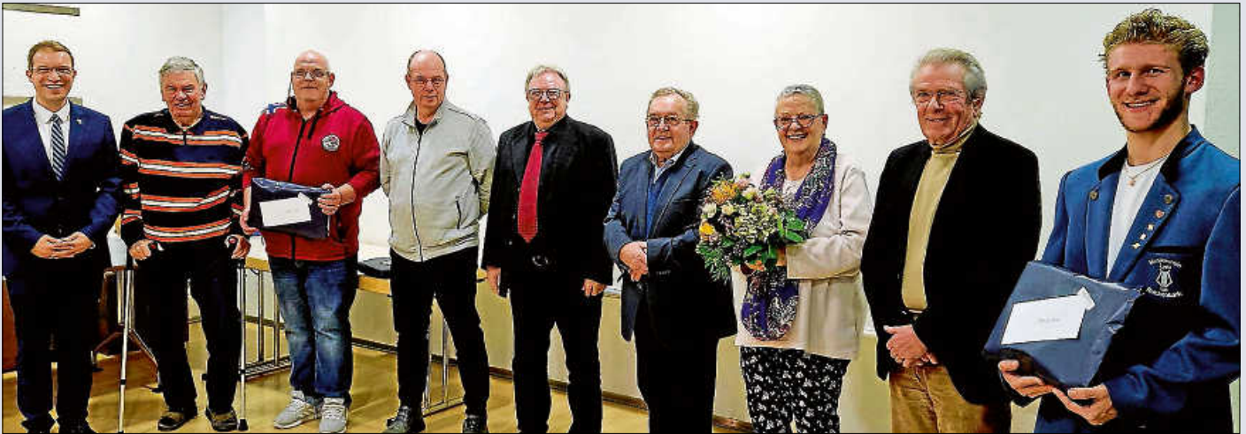
Die Ehrenamtlichen engagieren sich rund um die Uhr für ihren Verein.

Nach einem umfangreichen Ehrungsabend blieb allen Beteiligten noch genügend Zeit für ein nettes Gespräch unter Gleichgesinnten. Seite 2 und 3. Die Bilder mit vielen Menschen gerne etwas größer ziehen.