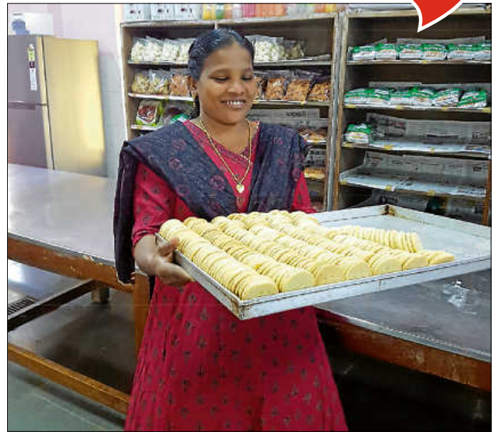
Die Bäckerei mit Herz lädt wieder zu einem großem Frühschoppen ein. Mit den Spenden wird ein Hilfsprojekt in Indien unterstützt.