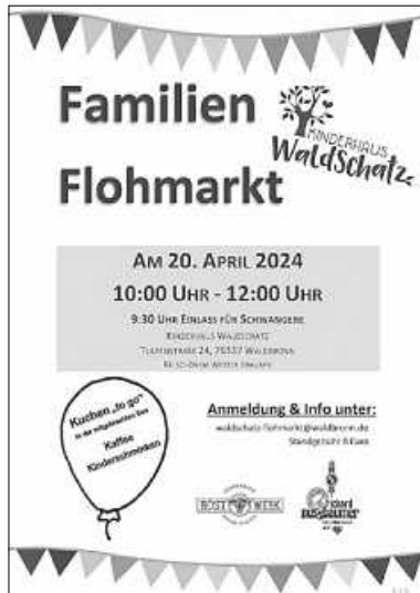
Plakat: Kinderhaus WaldSchatz