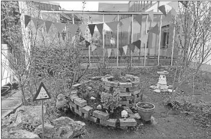
Feierlich wurde die Kräuterschnecke eröffnet

Am letzten Tag wurden die Kräuter eingepflanzt, die Dekoration verteilt & ein herrliches Festessen bereitet. Gemeinsam feierten wir stolz unser Werk & hoffen auf eine reiche Ernte für die Albert-Schweitzer-Schule & die Villa Alberti.