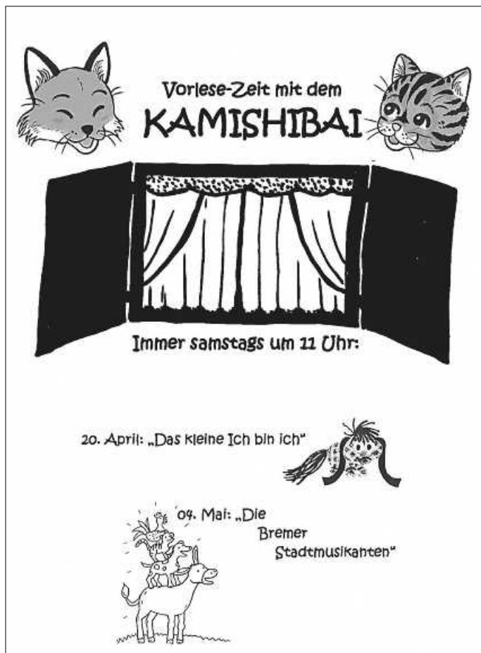
Plakat: Trägerverein Kinder- und Jugendbücherei Waldbronn e.V.

Tipp: Auf Instagram und Facebook gibt's immer wieder Neuigkeiten von uns!