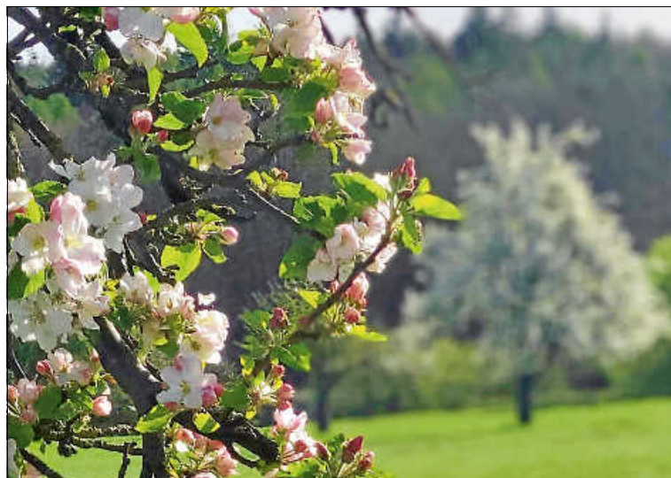
Die Streuobstwiesen stehen in voller Blüte und laden zum Verweilen in der Natur ein.