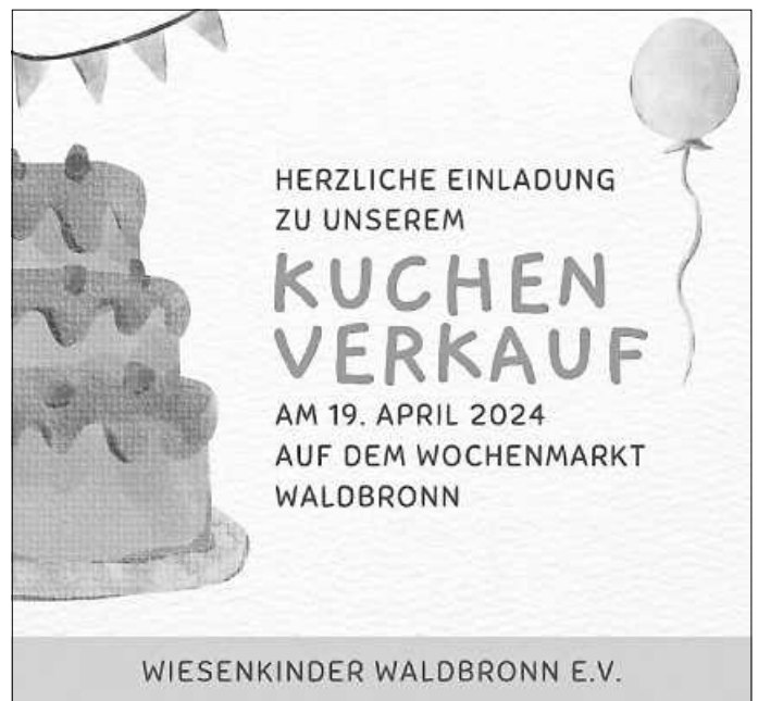
Plakat: Wiesenkinder Waldbronn e.V.

Wir heißen neue Mitglieder herzlich willkommen und freuen uns über jede helfende Hand sowie das Interesse an unserem großen Vorhaben. Für weitere Informationen stehen wir gerne unter info@wiesenkinder-waldbronn.de zur Verfügung.