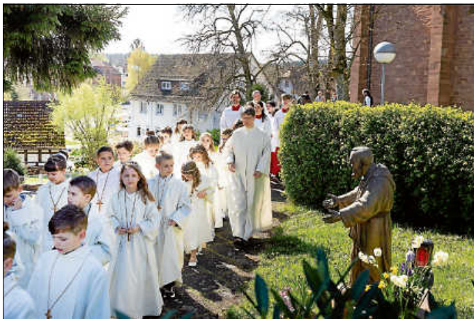
Am vergangenen Wochenende wurde in Waldbronn die Heilige Kommunion gefeiert.

46 Kinder aus Waldbronn haben am vergangenen Wochenende (gemeinsam mit 17 Kindern aus Karlsbad) ihre Feierliche Kommunion gefeiert. In dem diesjährigen Mottolied heißt es: „Schritt für Schritt – Du gehst mit.“ Der Liedtext greift die Erfahrung der Emmausjünger auf: Traurig verlassen sie Jerusalem und reden miteinander über alles, was in Jerusalem mit Jesus passiert ist. Da kam Jesus und ging mit ihnen mit. Doch die zwei erkannten ihn nicht. Sie erkannten ihn auch nicht, als er ihnen erklärt, warum das alles so kommen musste und es schon in der heiligen Schrift so steht. In Emmaus angekommen laden die beiden Jesus ein, bei ihnen zu bleiben. Jesus ging mit ins Haus und setzte sich mit ihnen an den Tisch. Dann nahm er das Brot, sprach den Lobpreis, teilte das Brot und gab es den Jüngern. Als die Jünger Jesus erkannten, war er nicht mehr zu sehen. Voller Freude gingen die Jünger zurück nach Jerusalem, um den anderen Jüngern davon zu erzählen, dass sie Jesus gesehen haben, er sei wirklich auferstanden (nach Lk 24,13-35). Im Gespräch, im gemeinsamen Unterwegssein, in der Tischgemeinschaft erfahren die zwei Jünger Schritt für Schritt, dass Jesus, der Auferstandene, als treuer Weggefährte weiterhin mit ihnen geht. „Diese Erfahrung und Erkenntnis wünschen wir auch den Kommunionkindern. Wenn sie die Heilige Messe besuchen ist Jesus im Wort