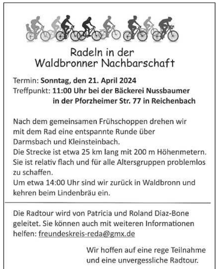
Plakat: B. Arnold

Freundeskreis Reda-Waldbronn lädt alle Mitglieder und alle Interessierten zu einer Radtour ein: