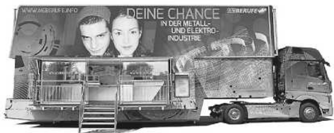
Grafik: A. Richter

Im Fahrzeug stellten zwei Referenten die vier Berufsfelder (Metallberufe, Elektroberufe, IT-Berufe oder Kaufmännische Berufe) und deren Ausbildungsberufe vor. Zudem lernten die Schülerinnen und Schüler unterschiedliche Arbeitsweisen zu den jeweiligen Bereichen kennen. An exemplarischen Arbeitsplätzen aus den M+E-Berufsfeldern konnten die SchülerInnen dadurch viele interessante Einblicke aus der Metall- und Elektroindustrie erhalten. So wurde an einer CNC-Fräsmaschine ein Werkstück aus Metall bearbeitet oder mithilfe eines Industrieroboterarms ein Zahnradgetriebe zusammengebaut. Ein interessanter Einblick und gelungene Abwechslung für unsere Schülerinnen und Schüler.