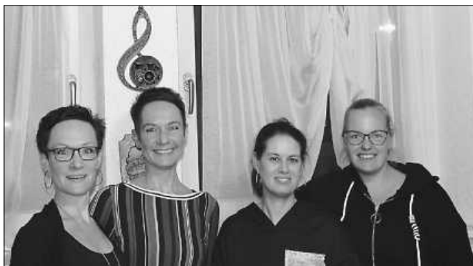
Das Kids-Betreuerteam

Du hast Spaß am Singen und möchtest diesen Spaß zusammen mit anderen teilen? Dann bist du bei den CONCORDIA Kids genau richtig.