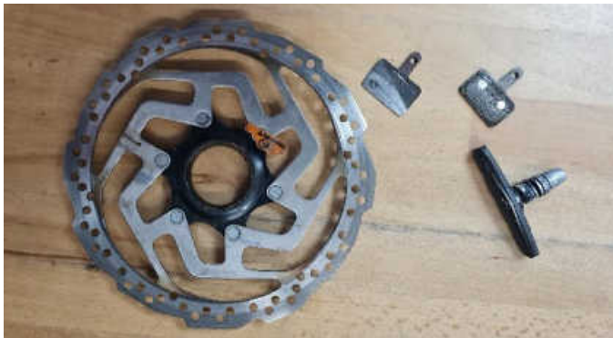
Sehen Ihre Bremsscheiben und Bremsklötze auch so aus? Jetzt Termin für einen Fahrrad Frühjahrs-Check vereinbaren.

persönliche Bedürfnisse anzupassen. Sehr gefragt ist auch der MRS Rundum-Check fürs Fahrrad“. Hier wird nicht nur gecheckt, ob noch genug Luft im Reifen ist und ob die Beleuchtung funktioniert. Auch Schaltung und Bremsen werden auf Verschleiß geprüft und nachgestellt. Wer sein Elektrofahrzeug fit für den Frühling machen lassen möchte, ist in Michas Rad Shop ebenfalls gut beraten. Natürlich bekommt man dort auch Zubehör von der Glocke, über das Beleuchtungsset, den Helm bis hin zum Fahrradschloss.