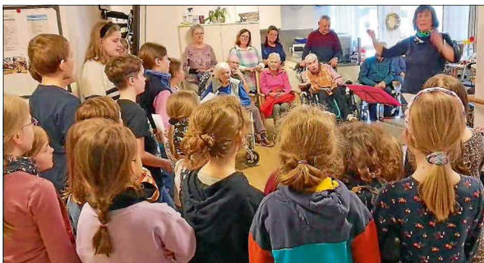
Der Kinderchor sang bereits zum dritten Mal im Seniorenhaus - sehr zur Freude der Bewohnerinnen und Bewohner.

Gemeinsam stimmten am Ende des Programmes alle wieder in das Badnerlied ein! Herzlichen Dank dem Chor und seinen Betreuerinnen für die gelungene Darbietung! (Text Pierre Eckert, Heimleitung)