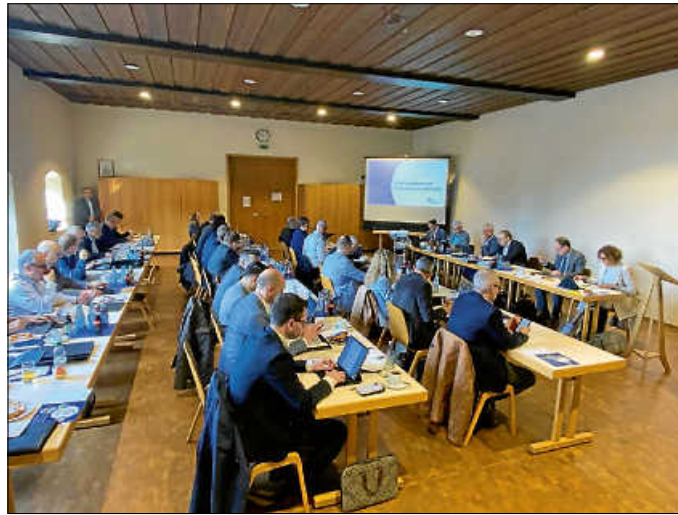
Die jüngste Bürgermeisterversammlung fand im katholischen Pfarrheim in Kronau statt.

Ein Sachstand wurde bei der Breitbanderschließung gegeben: beim geförderten Ausbau konnte eine Gesamtförderung von 120 Mio. EUR erzielt werden, mit 4.587 von 25.000 erreichbaren Kunden wurden bereits Verträge geschlossen. Appelliert wurde an die Kommunen, bereits zugesagte Förderungen einzulösen und die Erschließungsarbeiten zügig anzugehen. Für den eigenwirtschaftlichen Ausbau wurde eine Kooperationsvereinbarung mit der Deutschen Glasfaser GmbH geschlossen. In fünf Gemeinden wird bereits gebaut, bei den anderen 23 Ausbaubereichen der Städte und Gemeinden finden intensive Abstimmungsgespräche zwischen der Deutschen Glasfaser und der Breitbandkabelgesellschaft statt. Einig war sich die Bürgermeisterrunde, dass ein flächendeckender Ausbau weiter angestrebt werden soll. Kreisvorsitzender Nowitzki konstatierte, dass die Gründung