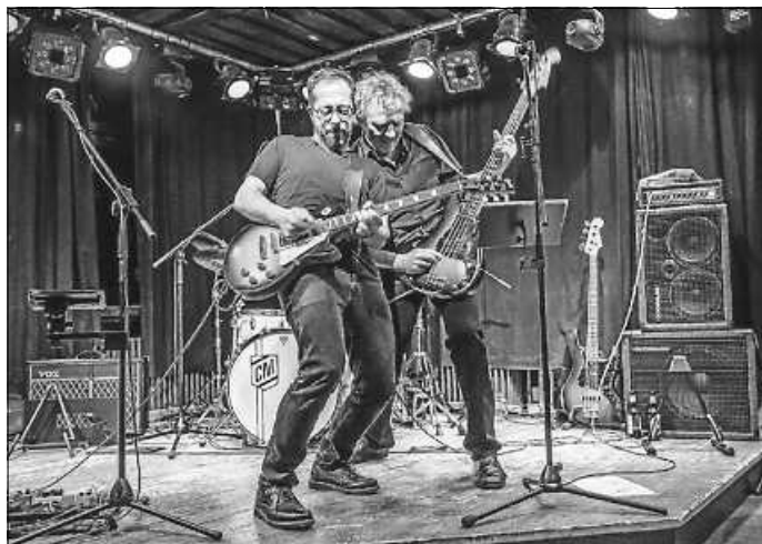
The New Sturdy Blues Band

Unsere Veranstaltungen 2024 gehen weiter in der Waldbronner Woche - Kooperation mit „Karlsruhe Klassik“