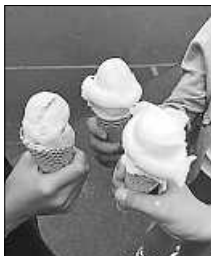
leckeres Eis zum Schuljahresende

Ein großes Dankeschön geht an Herrn Siegel von „SWP Ingenieure + Sachverständige“, der in diesem Jahr mit einer großzügigen Spende den Eiswagen finanziert hat.