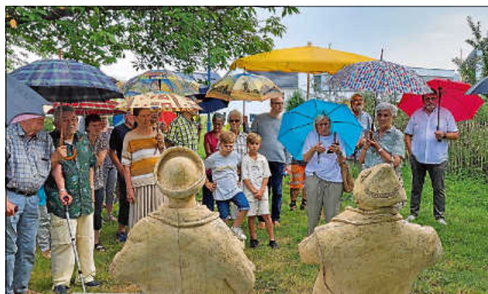
Zur symbolischen „Übergabe“ kamen einige Besucher und bestaunten die Skulpturen von dem Bildhauer Peter Lenk.