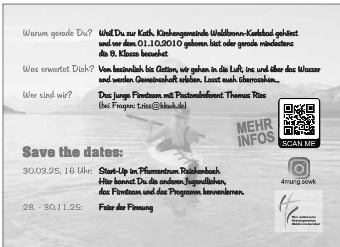
Plakat: M. Bartberger

Termin: Montag, 17. Februar, 18.30 Uhr Gemeinsames Singen geistlicher Lieder Wir singen Lieder aus den „Kreuzungen“ und laden alle Frauen herzlich dazu ein. Ort: Musiksaal, Anne-Frank-Schule