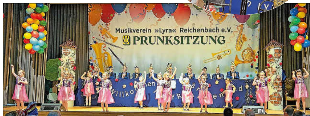
Allerliebste anzusehen: die Minis bzw. die Saphirgarde (ehemals Tanzmäuse) auf der Bühne