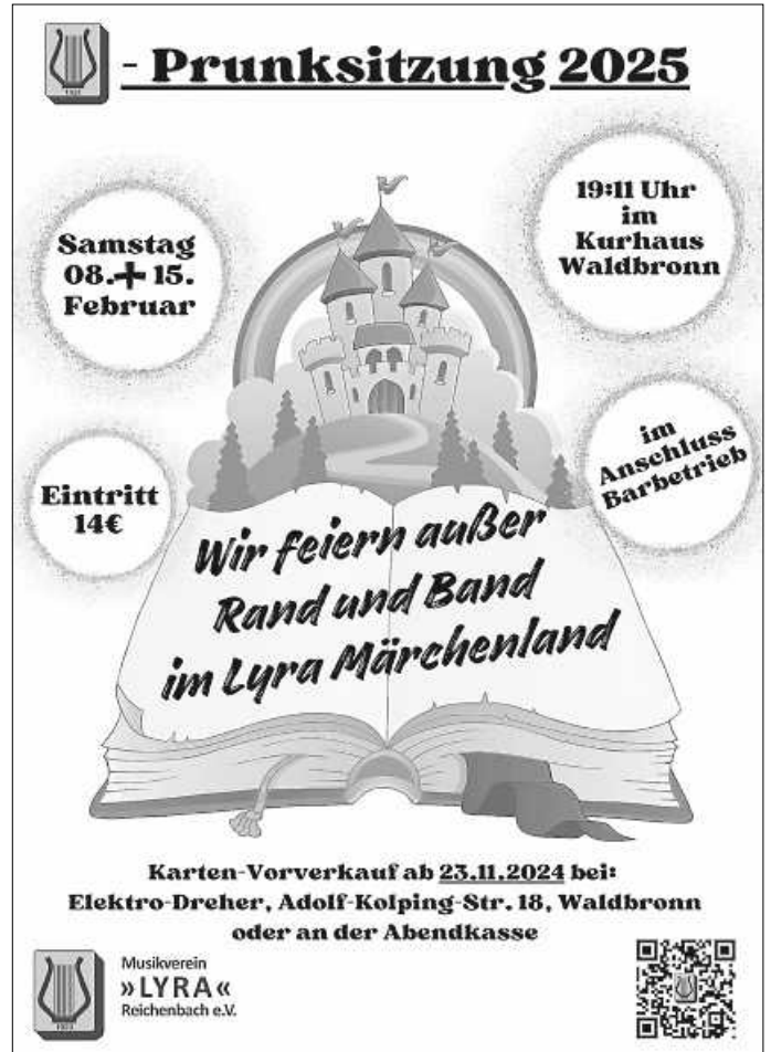
Plakat: MV Lyra Reichenbach

Einen ausführlichen Bericht über die beiden Veranstaltungen gibt es kommende Woche hier im Amtsblatt, auf unserer Homepage sowie in der BNN!