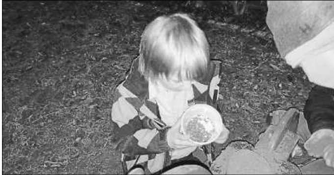
Die ersten Goldfunde.