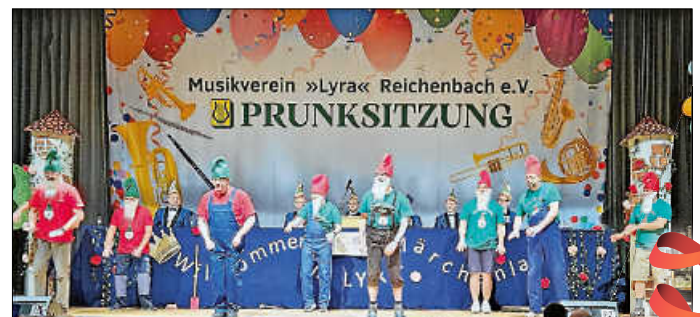
Filigran und synchron: die „Kronjuwelen“, sprich: das Männerballett von der Lyra

Info: Lesen Sie im nächsten Amtsblatt einen ausführlichen Bericht über die Prunksitzungen der Lyra.