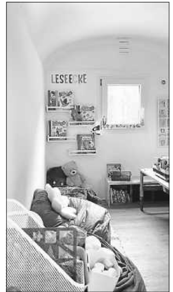
Ausgebauter Innenbereich der Schutzunterkunft

Auch wenn die ersten Wiesenkinder sich bereits in ihrem neuen Kindergarten wie zu Hause fühlen, steht das Vereinsleben auch abseits des Kindergartenalltags nicht still: Am letzten Samstag kamen bei schönstem Winterwetter viele Eltern und Kinder zu einem weiteren Arbeitseinsatz zusammen. Es wurde unter anderem Holz für den Ofen gespalten, eine Treppe mit einem Handlauf versehen, mehrere Regale, Fußleisten und Bilder in der Schutzunterkunft angebracht und das Gelände mit einer Stoffgirlande verschönert. Darüber hinaus wurde einiges um- und weggeräumt, viele nicht mehr benötigte Dinge entsorgt und an verschiedenen Stellen für mehr Ordnung gesorgt. Wir bedanken uns bei allen Beteiligten für die tatkräftige Unterstützung, das Mitbringen von Materialien und Werkzeug, viel handwerklichem Know-how und die Versorgung mit allerlei Leckereien. So macht die Arbeit einfach Spaß!