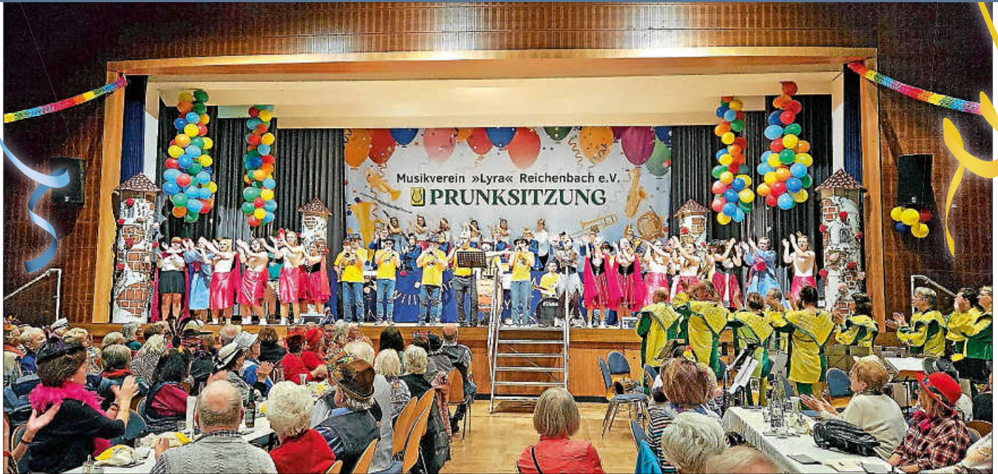
Das große Finale mit den Lyra Fetzern

Hier wird geschunkelt, gesungen und gelacht