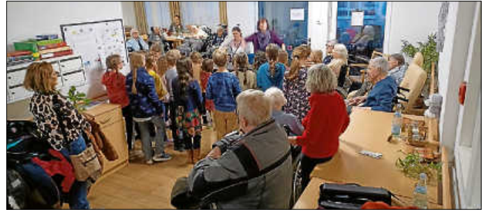
Der Waldbronner Kinderchor hat im Seniorenhaus am Rathausmarkt gesungen.

Ein Neujahrskanon eröffnete den Reigen verschiedener mit viel Herzblut gesungener Lieder, darunter auch ein Liedbeitrag, in dem verschiedene von den Kindern gespielte Instrumente zum Einsatz kamen. Besonders das Friedenslied „Frieden für die Kinder, Frieden für die Welt“ ging dem aufmerksamen Publikum unter die Haut. Das gemeinsam gesungene Badnerlied am Ende des Programms brachte die gute Stimmung wie bei jedem vorherigen Auftritt in der Einrichtung zum Höhepunkt, denn die Zuhörerinnen und Zuhörer, selbst das Personal, sangen lautstark mit und dankten dem Kinderchor mit langanhaltendem Applaus. (Text Pierre Eckert)